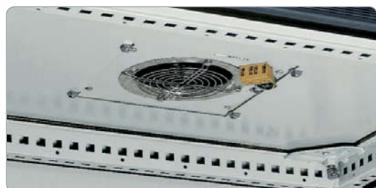
Ventilateur de toit réf. NSYCVF575M230MF / NSYCVF570M115MF